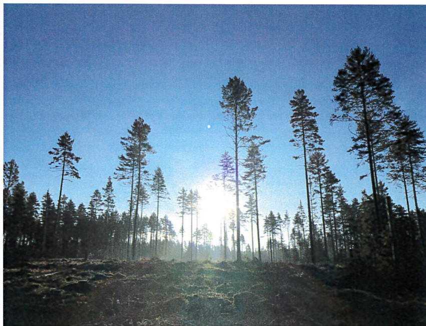
Frøfuru klar for tjeneste i Holtmarka

Årsmøtet 2019 holdes på Olalokka, Sand onsdag 3. april 2019 kl. 19.00.